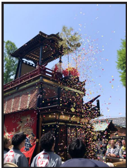
風薫る五月の空に @a.u1129