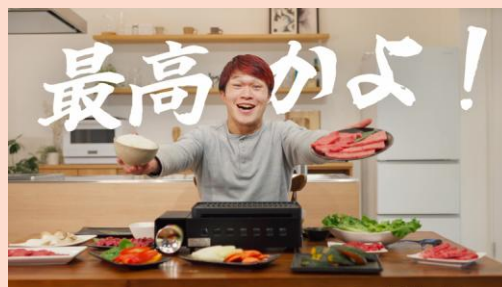
▲「うまい」だけじゃない、羽島市。 (羽島市ふるさと納税・産業観光PR動画)