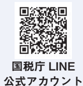
国税庁 LINE 公式アカウント