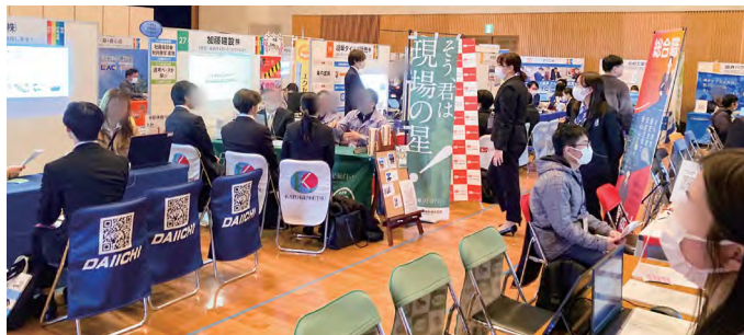
▲昨年度「オール岐阜・企業フェス」の様子

県内企業約200社が集う県下最大級の合同企業展「オール岐阜・企業フェス」を開催します。ぜひ参加ください!