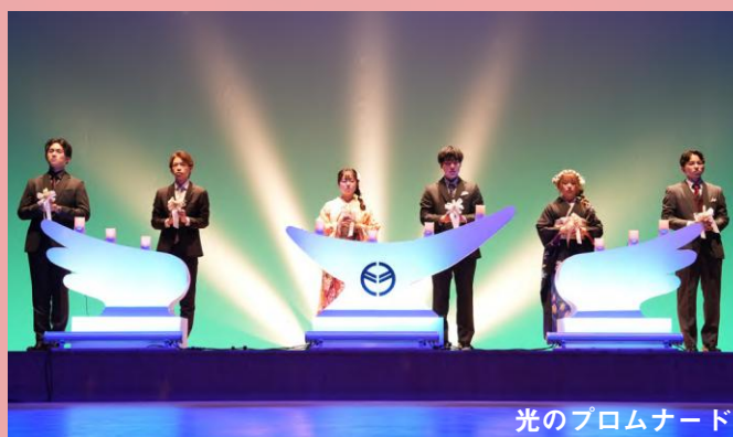
光のブロムナード