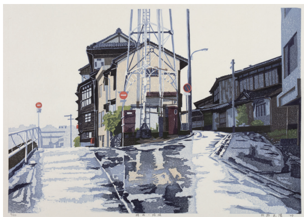
牧野光陽《時雨・蛤坂》 2009年 木版画