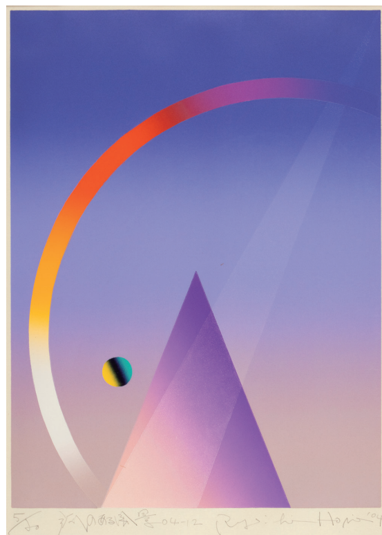
堀江良一《弧のある風景04-12》 2004年 木版画