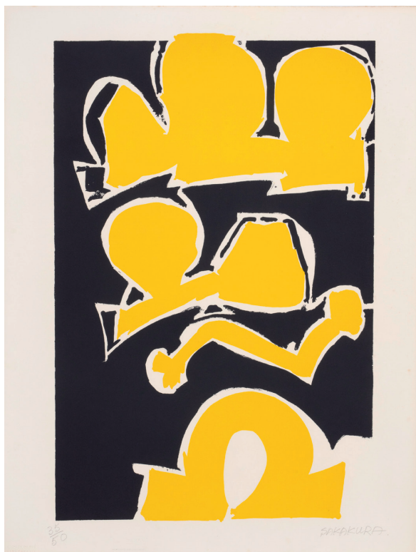
坂倉新平《九月の大地》 1973年 リトグラフ