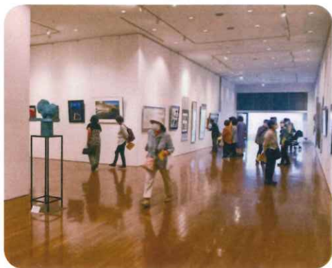
第44回 羽島市美術協会展