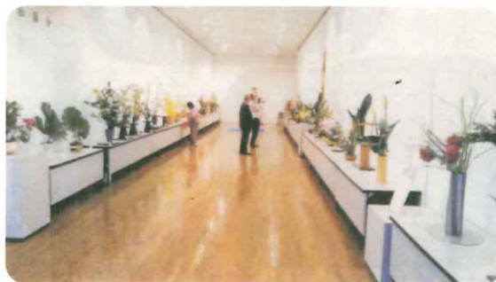
記念華展市民いけ花芸術展

昭和47年の設立以来、関係各位のご支援を頂くとともに、会員一同も研鑽に努め、今日まで華道の発展に尽力してきました。毎年開催する華展を今回は、連盟の創立50年を祝した「記念華展市民いけ花芸術展」として、令和5年4月16日に不二羽島文化センターにて開催しました。