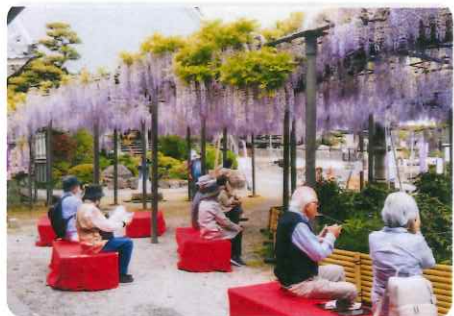
美濃竹鼻ふじまつり呈茶席

市民の皆様には伝統文化である「茶道」に関心をもち親しんでいただけたら、各流派協力力の元、