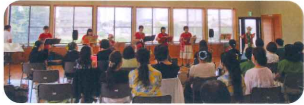
令和5年7月 ウクレレパーティー

羽島市の音楽文化の向上と普及を目標とし、色々なジャンルの音楽を楽しんでいる個人・団体が加入し活動しています。例えば、コーラス、ウクレレやギターなどのアンサンブル、フラダンスを楽しんでいる方々です。