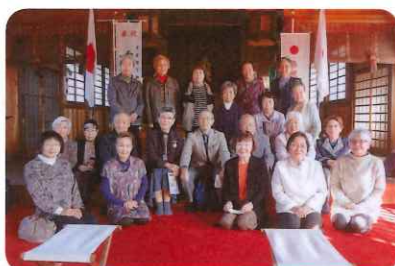
令和4年度 秋の研修会 八剣神社にて

短歌と俳句の6つのグループで構成し、それぞれ月に一・二回の勉強会を持ち研鑽を積んでいきます。藤まつり、羽島美濃菊展に協力を