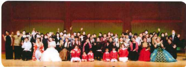
オペラ「カヴァレリアルステイカーナ」

昨年12月18日(日)コロナの心配の中、オペラ「カヴァレリアルステイカーナ」を上演。スカイホールにソリストと合唱団の歌声が一つに！！