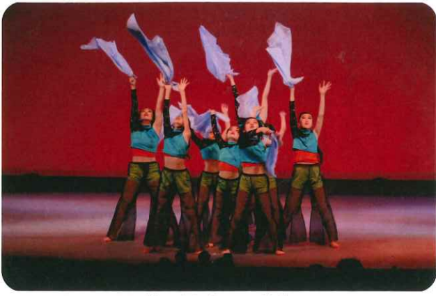
第51回 ジュニア公演