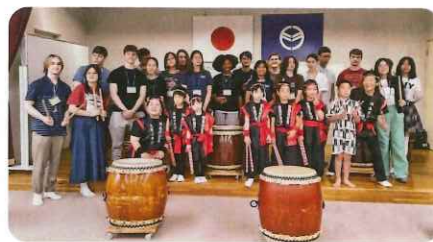
国際交流ウェルカムパーティー

「皆で楽しく！」と親子一緒になってがらばっています。コロナ禍の影響が少しずつ復帰し、イベントの出演依頼が増えました。会員同士の交流も多くなり、小さい子どもたちの成長を楽しみに練習にはげんでいます。諦めない強い精神を育んでいきたいと思えます。