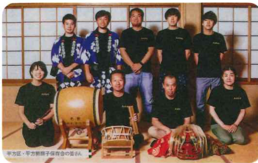
平方区・平方勢獅子保存会の皆さん。