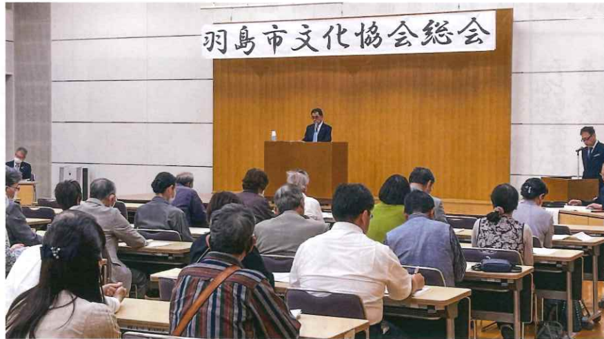
熱心に協議された総会の様子

発行 羽島市文化協会 〒501-6292 羽島市竹鼻町55 羽島市役所 生涯学習課内 TEL 058-393-4672・FAX 058-394-0025