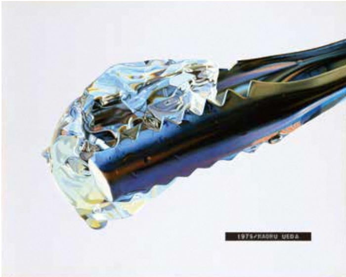
〈氷ばさみの水A〉1975年 油彩・アクリル、キャンバス

略歴：1928/東京都生。1954/東京藝術大学卒業。1956/MGM社ポスター国際コンクール(国際大賞)。1972~77/ジャパン・アート・フェスティバル(75/外務大臣賞)。1975・76/現代日本美術展(75/東京国立近代美術館賞 76/群馬県立近代美術館賞)。1985/茨城大学教授に就任(1993年まで)。近年は、2017/神奈川県立近代美術館 葉山、2020/横須賀美術館・埼玉県立近代美術館、2021/茨城県近代美術館、2023/高松市美術館等で展覧会を開催。