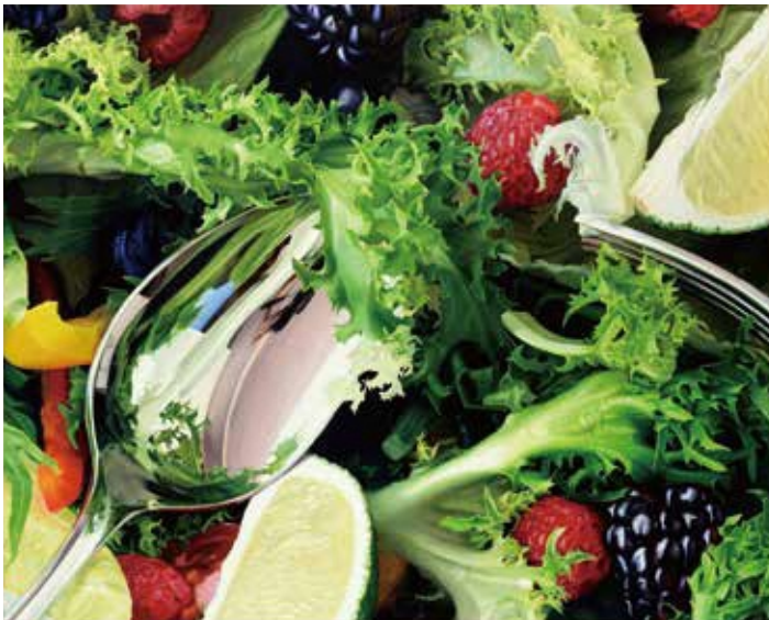
〈サラダE〉2014年 油彩、キャンバス