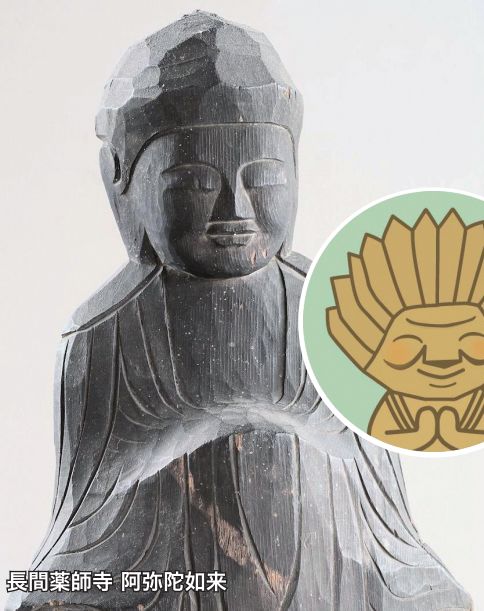
長間薬師寺 阿弥陀如来