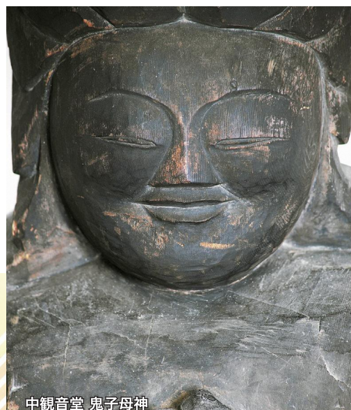
中観音堂 鬼子母神