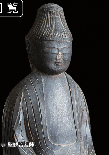
金宝寺 聖観音菩薩