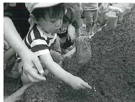
枝豆の種も植えました