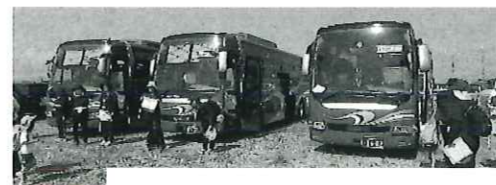
わくわくどきどき大型バス！