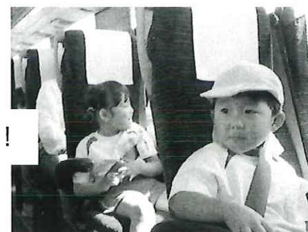
おやつ食べようかなあ～？