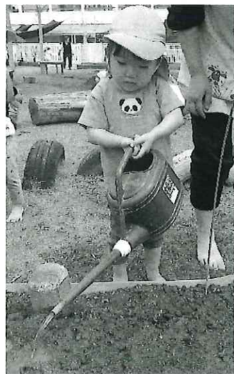
真剣に聞いて 真剣に植えます！