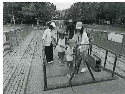
遊具でも楽しく遊べました