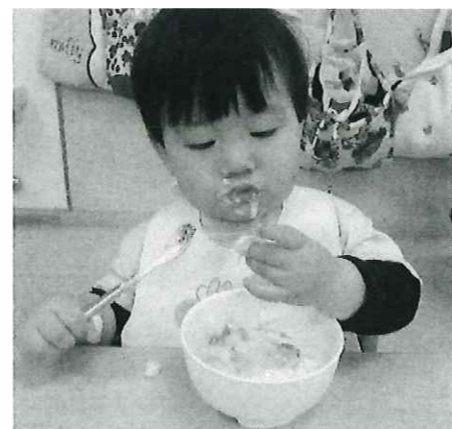
初めての場所で 知らない人の前 で食べて!! すごいよね~!!