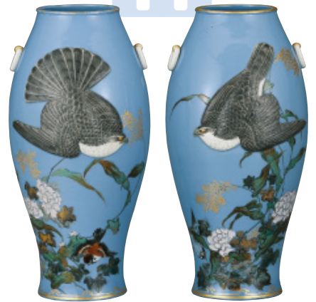
青地上絵金彩陽刻鷹図耳付花瓶(一对) 六代川本半助・瀧川惣助 明治時代(19世紀後期)