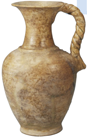
灰釉縄手付瓶 【重要有形民俗文化財】 平安時代(11世紀中期)