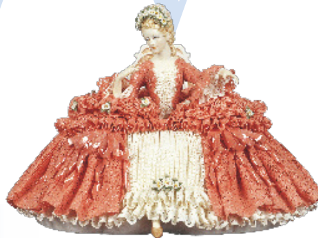
アン王女 テーカー名古屋人形製陶株式会社 平成3年(1991)