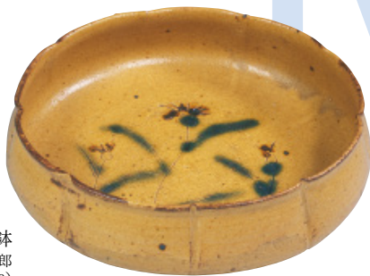
黄瀬戸輪花鉢 加藤唐九郎 昭和35年(1960)