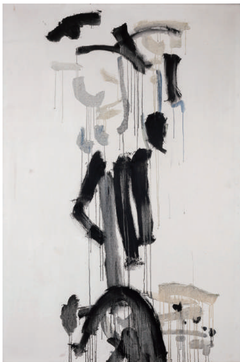
雅 1959年(不二竹鼻町屋ギャラリー蔵)