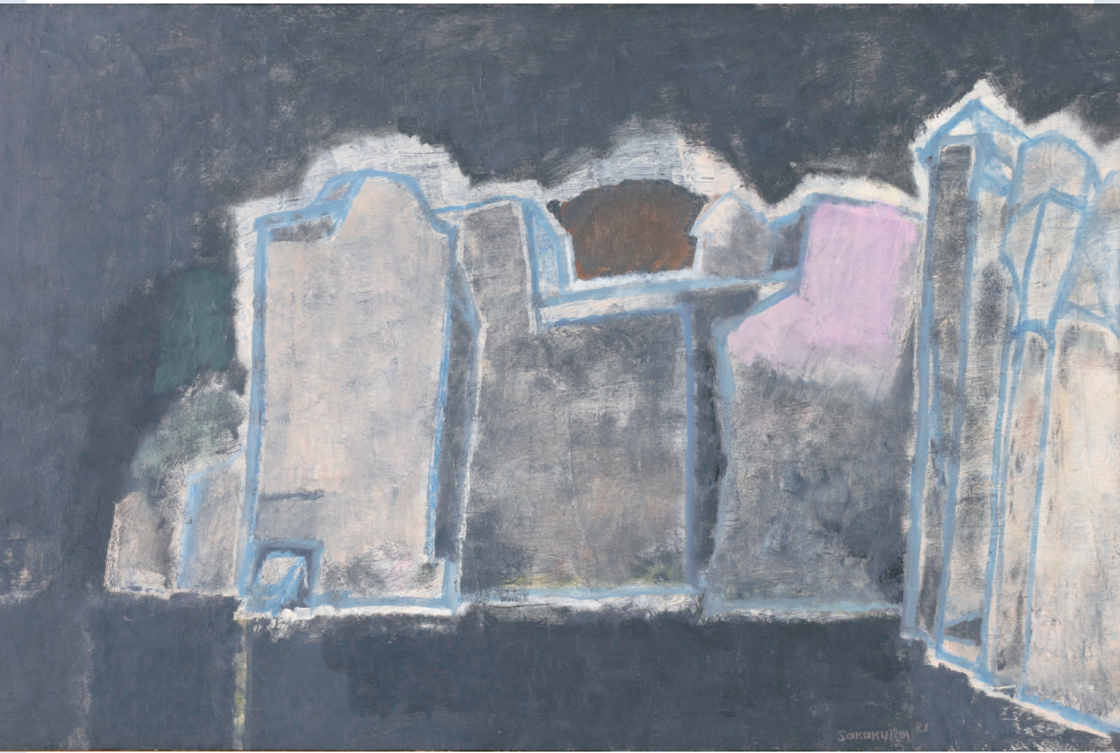
内なる光—しじま (沈黙1) 1981-88年 (個人蔵)