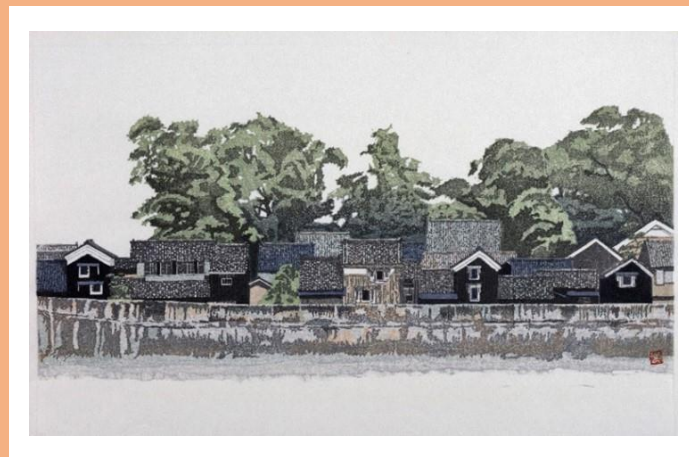
牧野 光陽《みの路 おこし宿》1994年 木版

本展覧会では、所蔵品の中から版画作品をご紹介します。さまざまな刷りの表情を魅せる—版画の美—をお楽しみください。