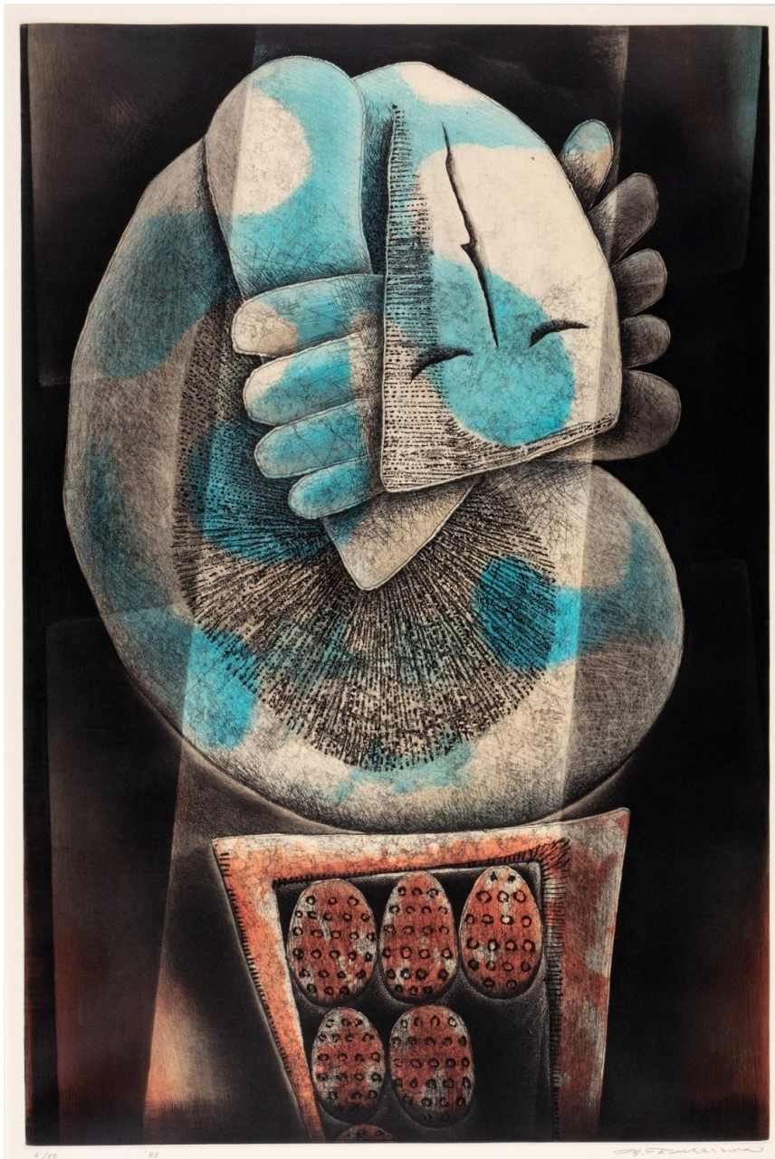
深沢 幸雄《青春の碑》1993年 銅版