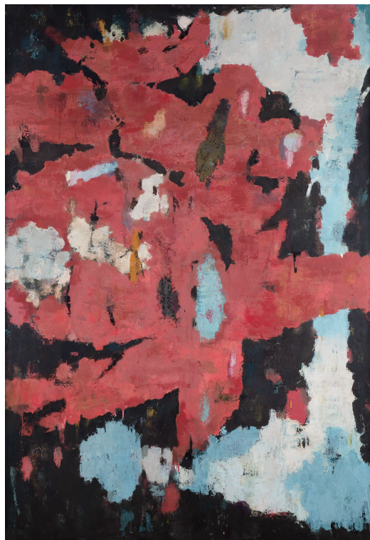
斎藤義重 作品A 1958年 (不二竹鼻町屋ギャラリー蔵)