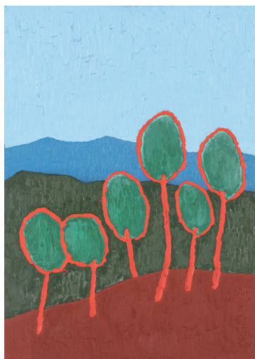
熊谷守一 松 1959年 (不二竹鼻町屋ギャラリー蔵)