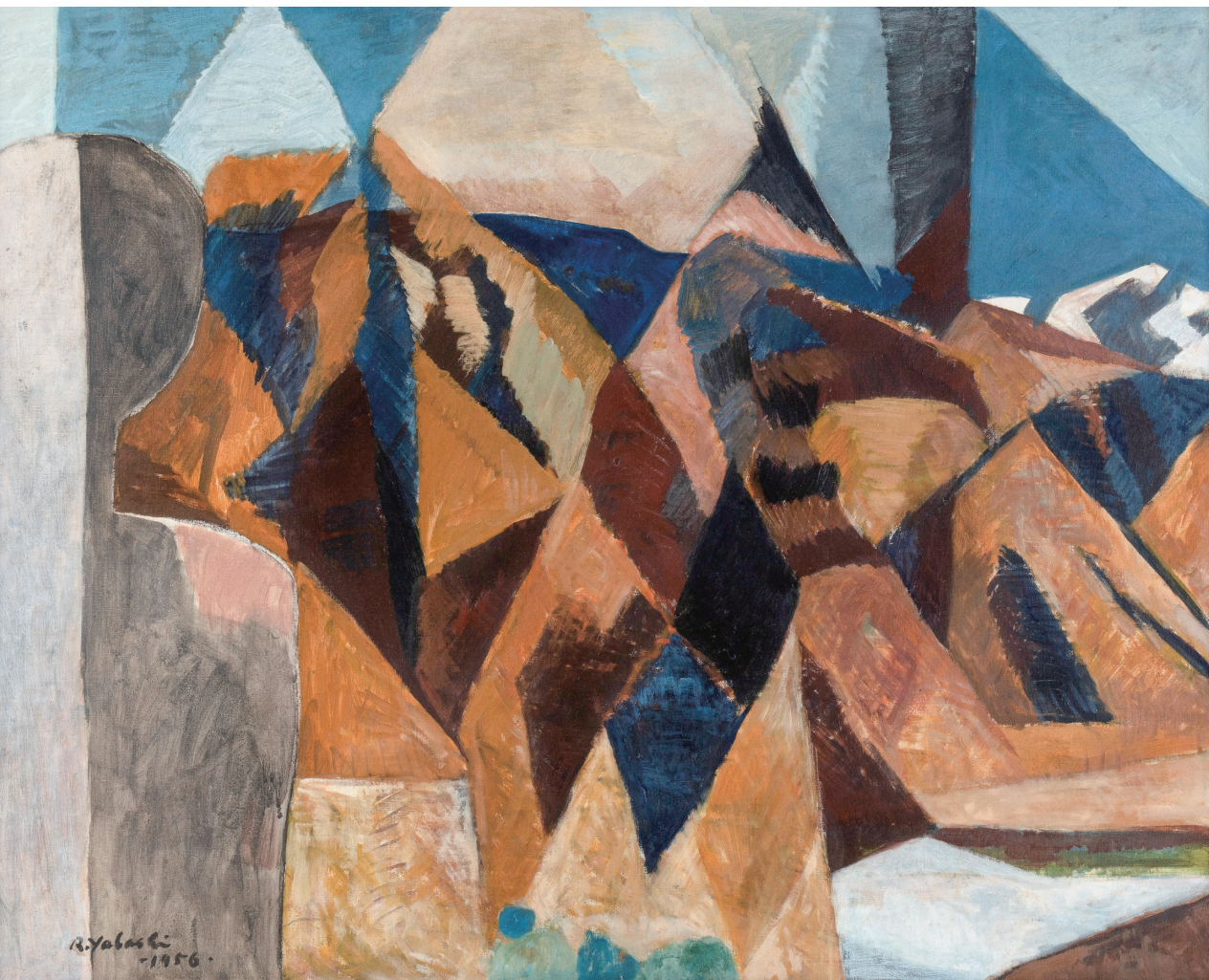
矢橋六郎 三月の山脈 1956年 (不二竹鼻町屋ギャラリー蔵)