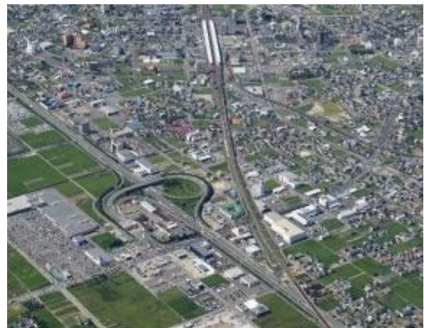
名神高速道路岐阜羽島インターチェンジ