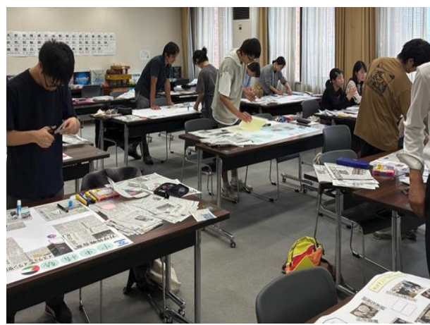
新聞切り抜き作品教室