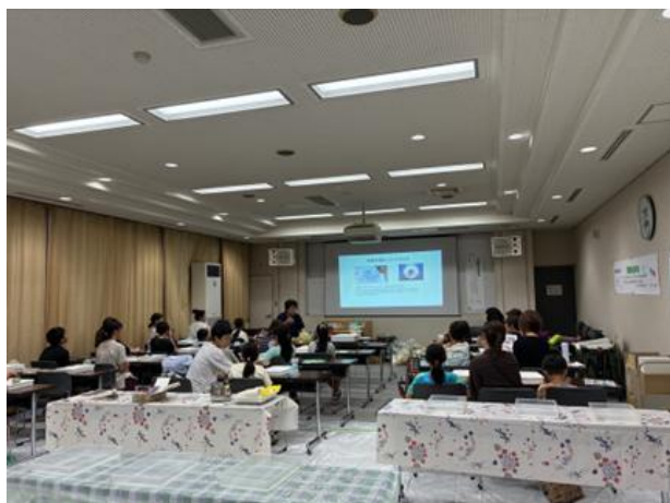
明かりや団扇づくり