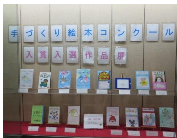
手づくり絵本コンクール 入賞作品展示