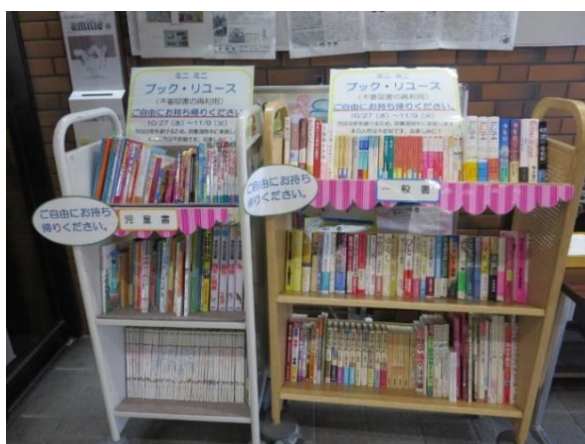
ミニミニブックリユース