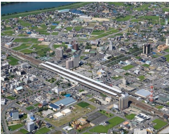
新幹線岐阜羽島駅