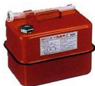
ガソリンの貯蔵に適した容器の例 (金属製容器であることが必要)