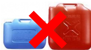
ガソリンの貯蔵に適さない容器の例 (樹脂製容器は火災危険性が高い)