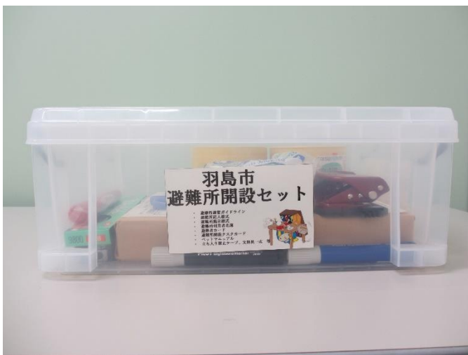
避難所開設セット