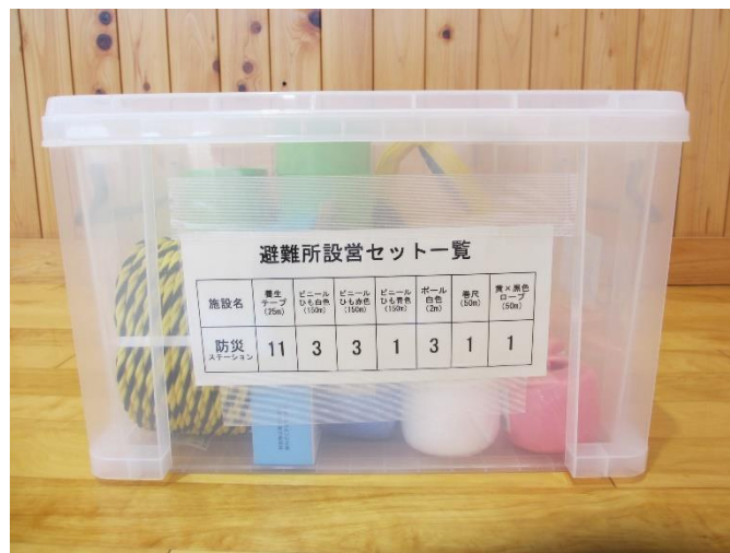
避難所設営セット