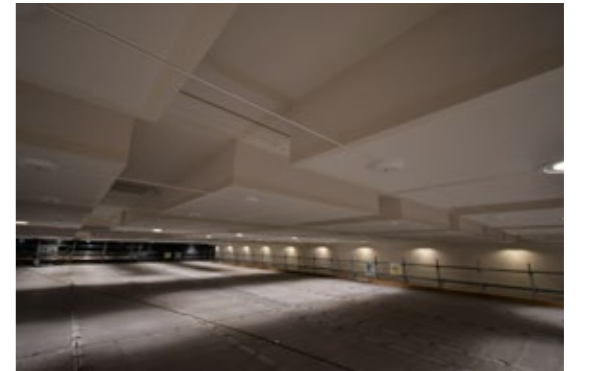
ワイヤ等で補強されたスカイホール天井