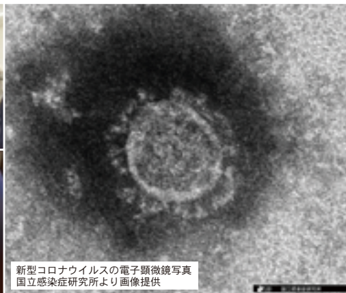
新型コロナウイルスの電子顕微鏡写真