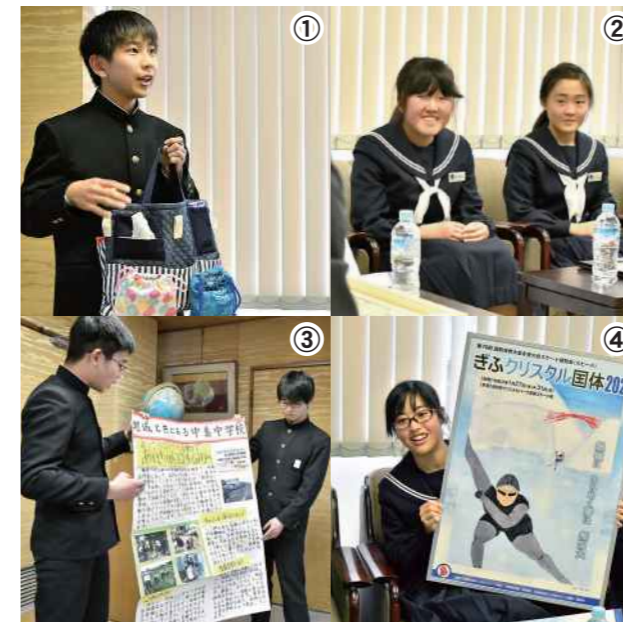
作品などを発表する受賞者