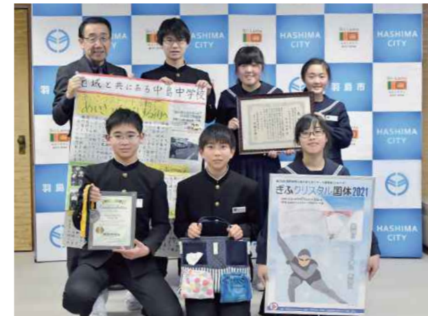
市役所を訪問し記念撮影する受賞者ら