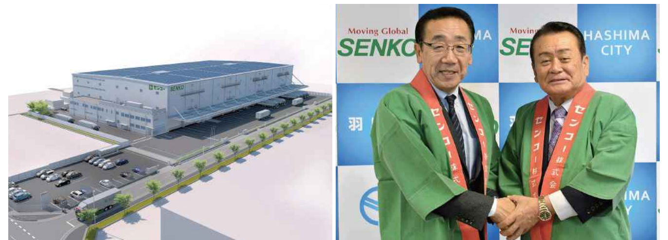
建設予定のPDセンター（物流施設） 令和3年夏の操業開始を予定