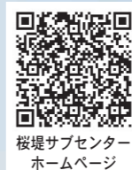
桜堤サブセンター ホームページ

会場では、家族そろって楽しめるイベントが盛りだくさん。木曾良背割堤の桜並木と合わせて、春の憩いを満喫できます。