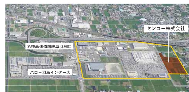
問い合わせ先 総合政策課（内線2345）

岐阜羽島インター南部東地区では、今回のセンコー株式会社の進出だけでなく、これまで日興製薬株式会社、株式会社コラント、中日本ハイウェイ・メンテナンス名古屋株式会社、スミ株式会社、コストコホールセールジャパン株式会社、サンフレッシュ株式会社が進出し操業を開始しています。企業を誘致する面積約22ヘクタールのうち、企業の進出率は9割を超えました。