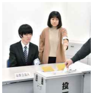
投票立会人イメージ

若い世代に選挙を身近に感じてもらうため、若者の投票立会人を募集しています。事前に登録の申請を行うことで、各選挙期日の決定後に参加できるかどうかのスケジュールを確認を行う事前登録制です。