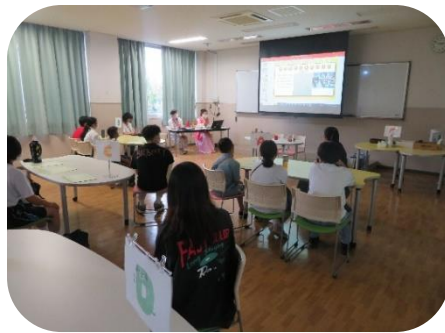
各国の紹介の様子

事前に「こんにちは」や「ありがとう」などの各国の挨拶を予習し、愛知文教大学へ向かいました。最初に留学生から、出身国の文化や参加した小・中学生と同年代の学校生活の様子などについて紹介がありました。民族衣装や写真を見せていただき、より詳しく外国の文化を知ることができたほか、より一層興味が湧いたようでした。