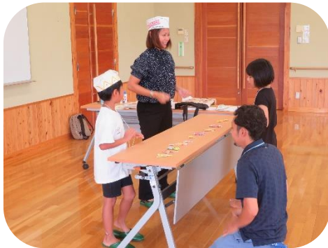
店員体験をしました