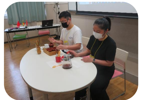
ジャスミン茶、コーヒーを淹れていただきました