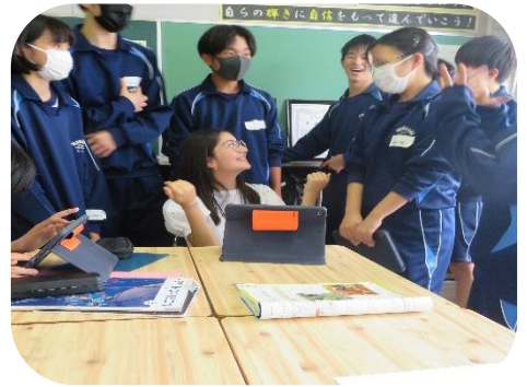
中学生と交流しました

次に、竹鼻中学校を訪問し、同校生徒と交流しました。英語で俳句を作成する授業をはじめ、給食の配膳や清掃活動など、学校の生活の一部を生徒と一緒に体験しました。タブレットによる翻訳のほか、ジェスチャーを使って互いにコミュニケーションを図る姿が印象的でした。