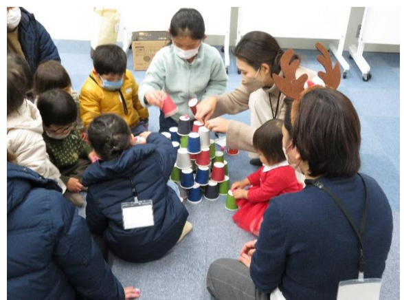
協力して作ったクリスマスツリー