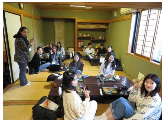
「正扇」にて記念撮影

初めて「れんこんカツ丼」を口にした留学生からは、「美味しい！！」という声もあり、好評でした。地域の食文化を体験し、「地域に根付いた文化を知りたい。」と感じる留学生が多く、地域の魅力を伝える機会となりました。