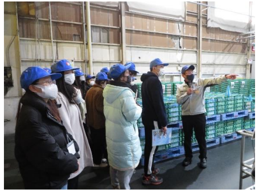
説明を受けている留学生

始めに、同社の企業概要について、留学生と同じ出身国の方から説明していただきました。海外に拠点を持っているため外国人が活躍していることなど、外国にも関連した話を聞いたことで、日本で働くことに興味を示す姿がありました。