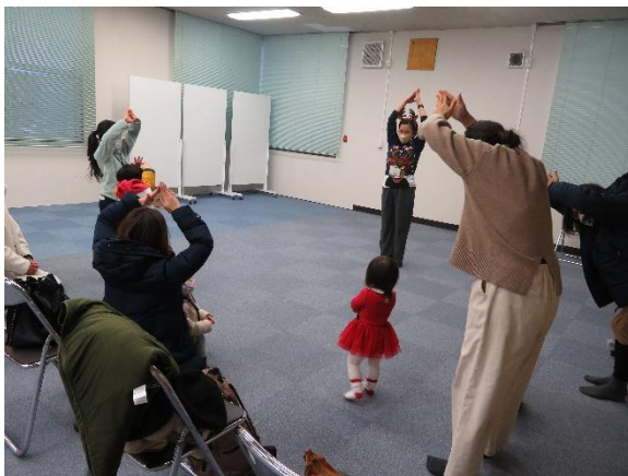
ジェスチャーゲームの様子

最後には、参加者全員で空のカップを積み上げ、頂上に飾りを付けてクリスマスツリーを作りました。子どもだけでなく保護者同士の交流の場ともなり、貴重な時間を過ごすことができました。