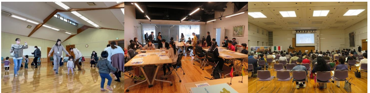
令和4年度に行われた各種イベント