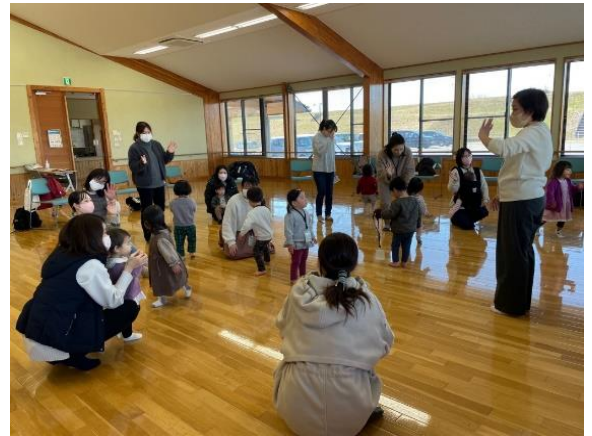
歌に合わせて体を動かします

来年度も毎月第3木曜日(月によっては変更あり)に開催予定です。大変人気の事業となりますので、早めのご連絡をお待ちしています。