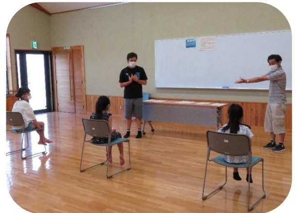
先生の質問に答える子どもの様子

始めに、ボールを使ってジョン先生の質問に答えていくキャッチボール形式の英会話を行い、楽しく学びました。