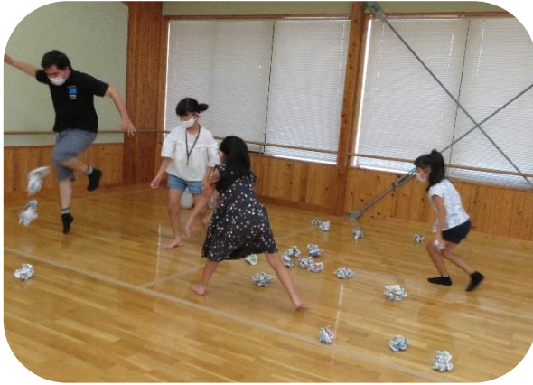
陣地取りゲームで数の数え方を英語で学びました

次に新聞紙を丸めて作ったボールを使用した陣地取り形式のゲームをしました。時間内に相手の陣地にボールを置いた数を「How Many?」と尋ねて、数の数え方を英語で回答しました。体を使ったゲームで子どもたちも楽しく活動していました。