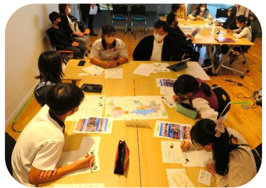
グループ交流の様子

他国について学べただけでなく、他国の学生と直接話したことで、互いを理解する貴重な機会となりました。