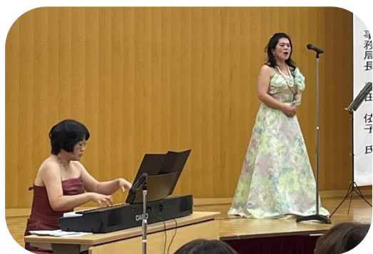
美しいカンツォーネの披露

生で披露される美しい歌声と演奏には、会場全体が聴き入りました。オペラ楽曲のほか、誰もが一度は耳にしたことがあるであろう楽曲「Volare(ボラーレ)」や「Santa lucia(サンタ ルチア)」も披露され、リズムに合わせて身体を揺らす方、歌を口ずさんでいる方もいらっしゃいました。