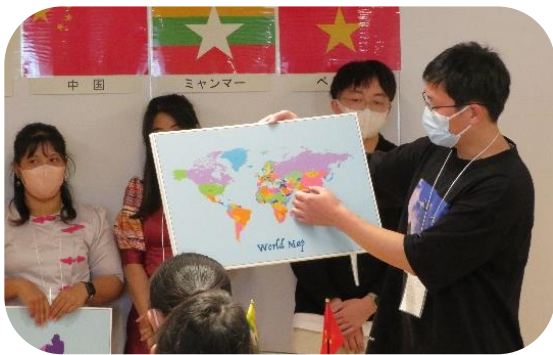
地図や写真などで出身国の紹介をする留学生