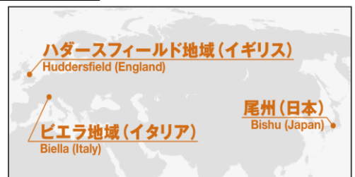
世界三大毛織物産地

土地の環境が、遠いイタリアの地と共通しており、互いに世界の産業を支えている、というとても興味深い講演をしていただきました。