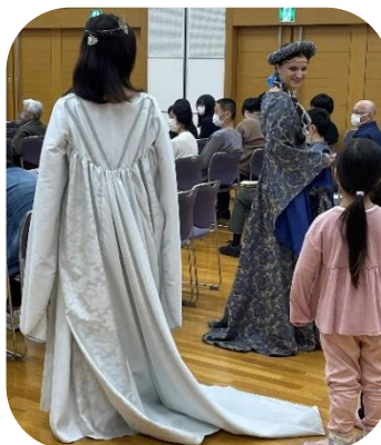
客席側も歩き、 間近で衣装を見られました