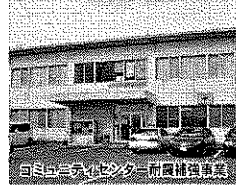
コミュニティセンター耐震補強事業