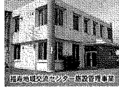
福寿地域交流センター施設管理事業