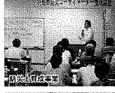
防災指導員養成事業