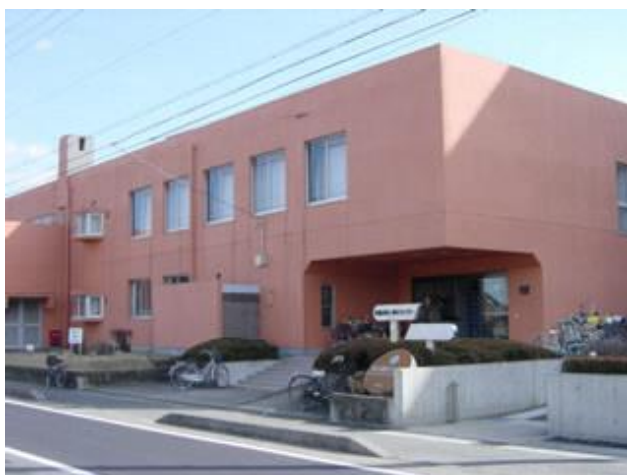
老人福祉センター

老人福祉センターは、老人福祉法に基づき、無料又は低額料金で、高齢者からの各種の相談に応じるとともに、高齢者に対して、健康の増進、教養の向上及びレクリエーションのための便宜を総合的に供与することを目的とする施設である。本施設では、入浴施設としての機能、生活相談及び健康相談に関する機能、教養講座の実施、サークル活動の利用、老人クラブの支援の機能を有している。