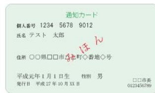
(表面) 通知カード (裏面)