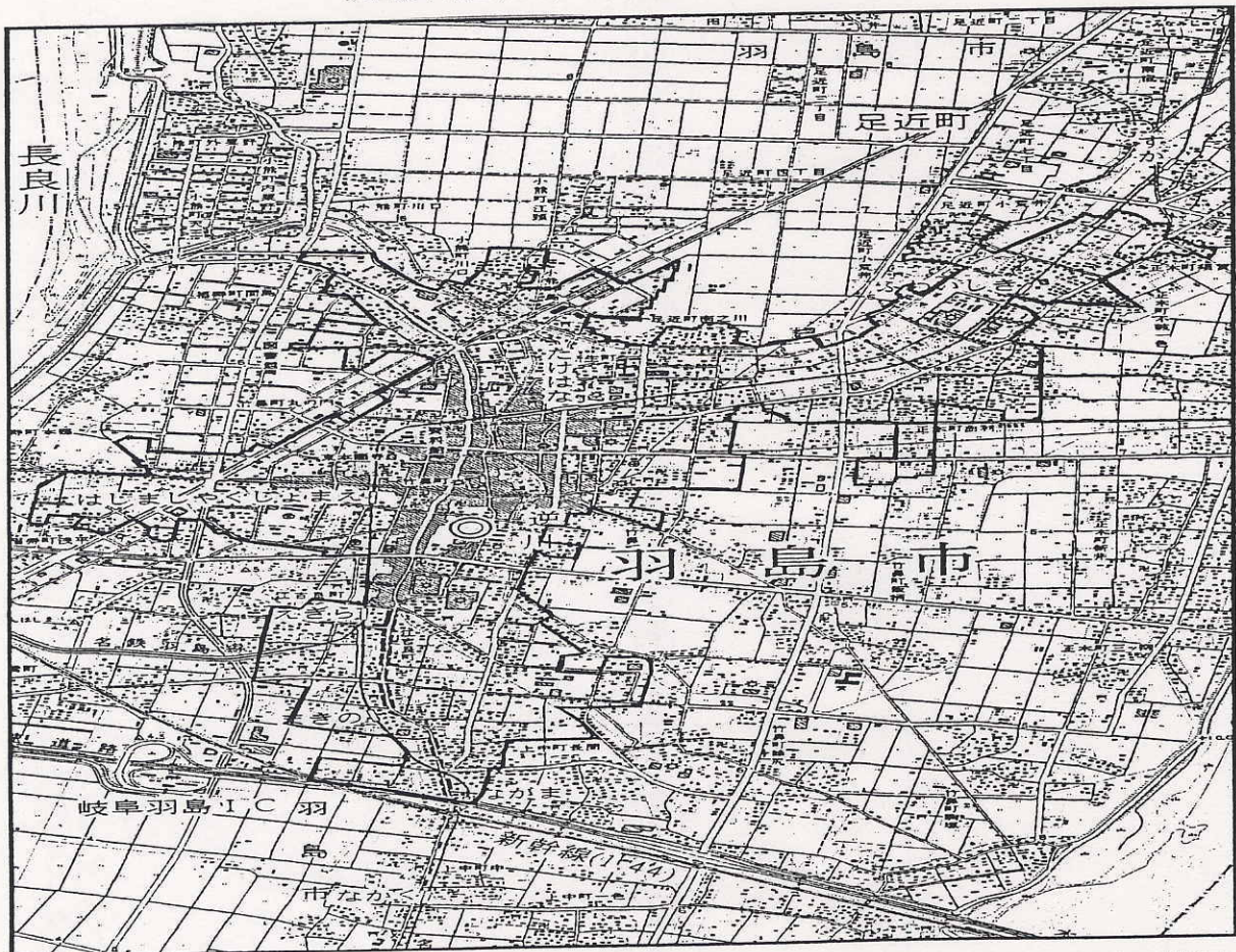
人口集中地区(DID) (平成12年国勢調査)