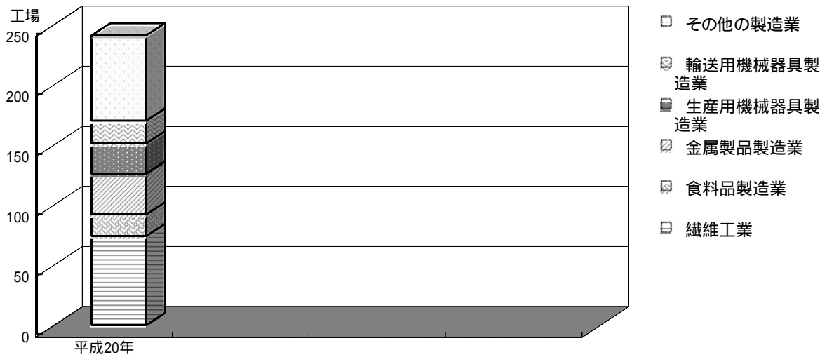
(1) 産業中分類別事業所数