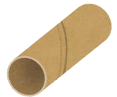
トイレットペー パーの芯