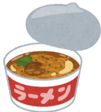
防水加工紙・ アルミ複合紙