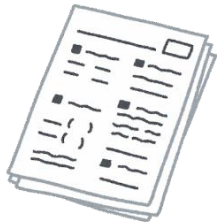
プリント・ メモ用紙