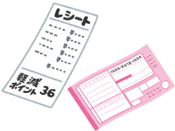
感熱紙・ カーボン紙